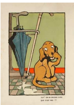
Benjamin Rabier « Zut , on va dire encore que c'est moi ! »