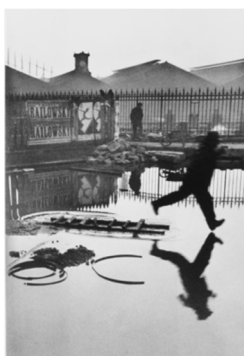
Derrière la gare Saint Lazare Henri Cartier-Bresson 1932