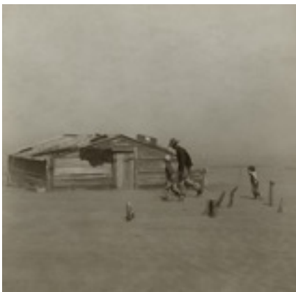
Tempête de poussière de Arthur Rothstein, 1936

La FSA (Farm Security Administration) est un programme mis en place par le président Franklin Roosevelt afin d'aider les fermiers les plus pauvres. Sa section photographique documente le Dust Bowl avec la mission de « présenter l'Amérique aux américains ».