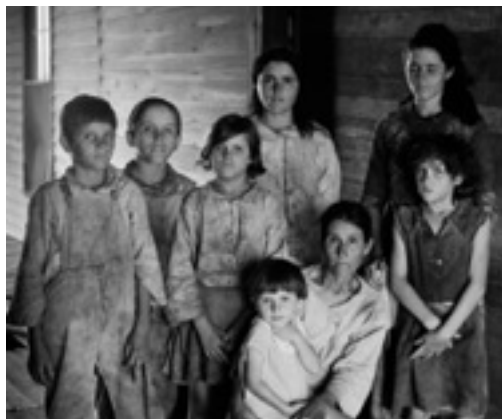
Famille Frank Tenge de Walker Evans, 1936