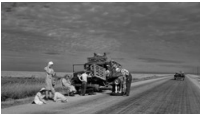
Photogramme de Paper Moon

Le Dust Bowl (bassin de poussière) est le nom donné à une région des Etats-Unis touchée dans les années 30 par la sécheresse et une série de tempêtes de poussière. Cette catastrophe écologique jette sur les routes des millions de personnes dans un exode vers l'Ouest (la Californie).