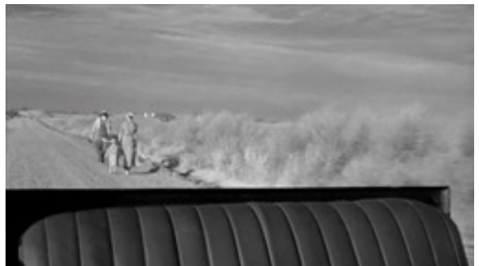
Photogramme de Paper Moon

Addie et Moses croisent des fermiers migrants sur la route. Addie veut leur donner de l'argent. Moses refuse.