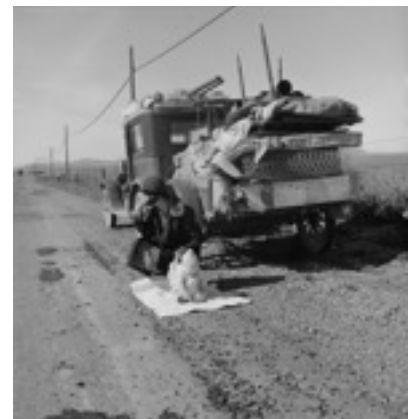
Famille migrante de Dorothea Lange, 1936