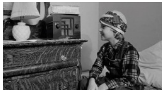
Photogramme de Paper Moon

Addie aime beaucoup les fictions radiophoniques, elle rit particulièrement au gag récurrent du placard en désordre. Gag mémorable du célèbre duo Fibber Mc Gee and Molly :